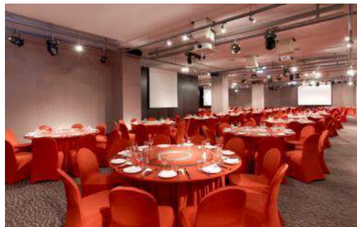
寒舍樂樂軒廳景照片