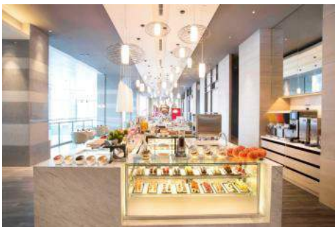
寒舍樂廚廳景照片

地址：115 台北市南港區經貿二路 1 號 3 樓(南港展覽館 3 樓) / 訂席電話：02 6619-1889