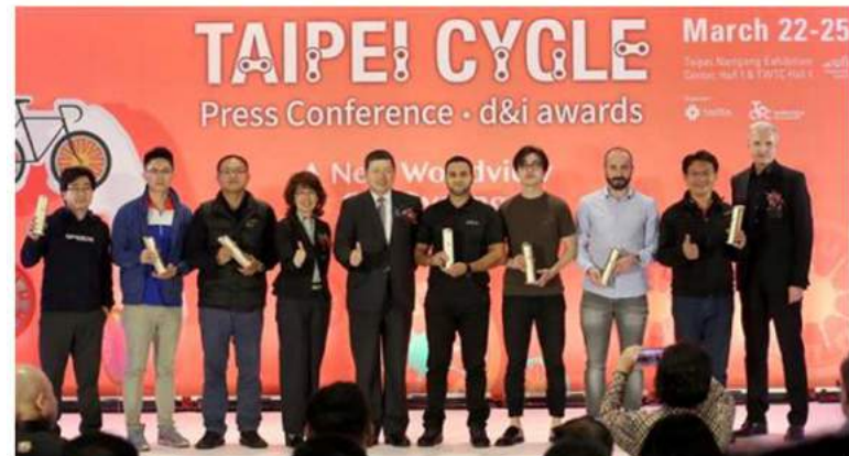
30週年全新里程碑 A New Worldview on Cycling

(中央社訊息服務20170322 09:15:37)第30屆台北國際自行車展 (Taipei Cycle) 今天於南港展覽館及世貿一館盛大開展，共吸引1,115家廠商參展，使用3,340個攤位，主辦單位中華民國對外貿易發展協會21日舉行展前國際記者會暨第6屆台北國際自行車展創新設計獎 (TAIPEI CYCLE d&i awards) 頒獎典禮。