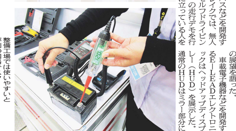
整備工場では使いやすい、評判の回路テスター