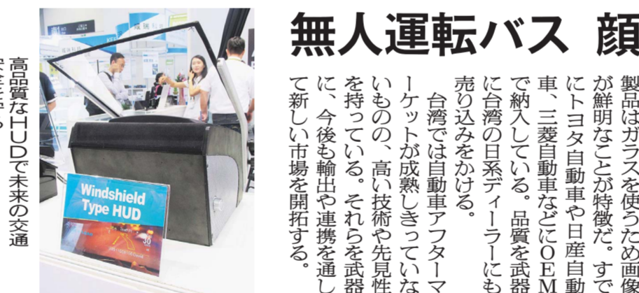
高品質なHUDで未来の交通を安全にする

ドライブレコーダーを製造販売するMITSUBISHIエレクトロニクスは、OEMと一般ユーザーそれぞれをターゲットにした製品を展示した。車載バッテリーを電源とするため長時間稼働できたり広角レンズの使用で視野を広く範囲化したりと、多岐にわたる製品群でニーズを取り込めるのが強みだ。同社は「ドライブレコーダーはロシアや台湾、中国、日本で流行っている」と市場を見ており、今後も通信機能がある製品などを市場投入して交通事故に備えたいとのニーズに込めている。