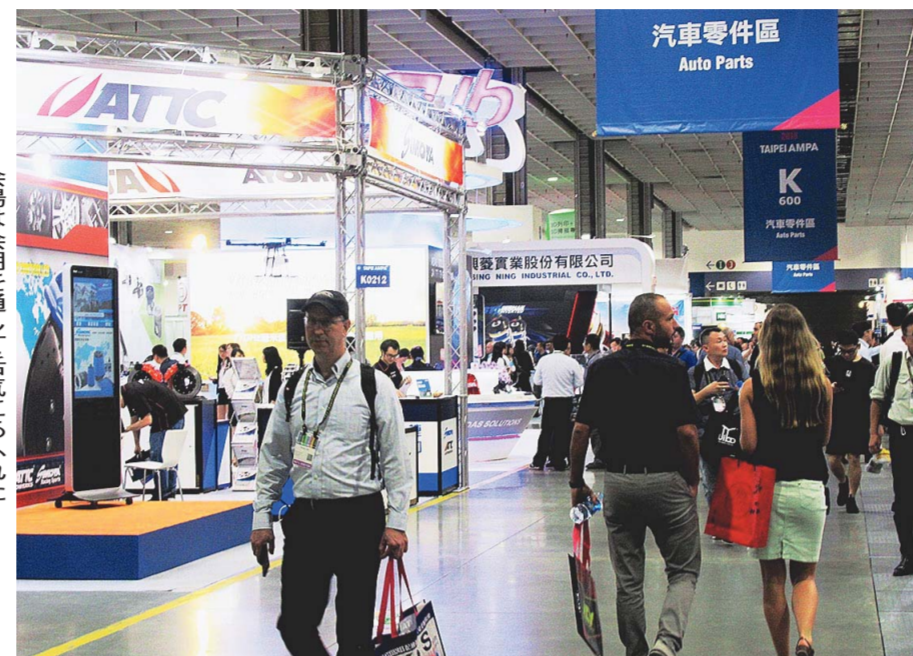
会場は会場を通して活気にあふれた