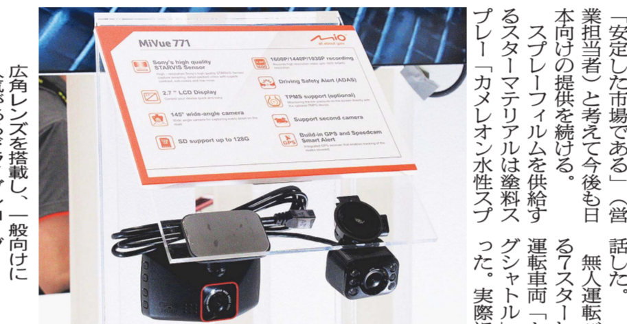
広角レンズ搭載し、一般向けに人気があるドライブレコーダー