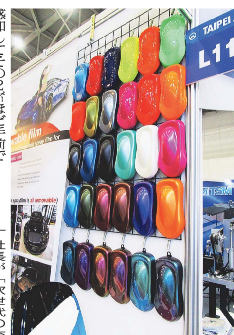
多種類の色を揃えて若者の心をつかむ

レーフィルムを紹介した。噴射式の塗料だが、乾燥後はフィルムのように粘りがなくなるため手軽に使える。水性なので環境にも優しい。台湾では自動車のカスタマイズに興味のある若者が多く、彼らのニーズを取り込むべくポディッシュを取り込むべく販売を行う。日本向けにも輸出しており「カ」であった。丁彦社長は「新しい交通手段によって人間の行動力を高められたら」と今後