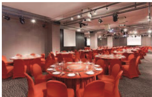
寒舍樂樂軒廳景照片