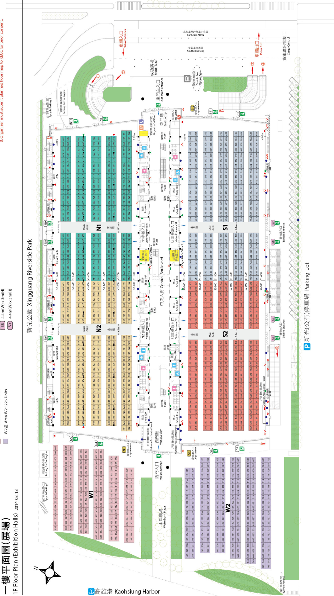
一樓平面圖(展場) 1F Floor Plan (Exhibition Halls) 2014.03.13