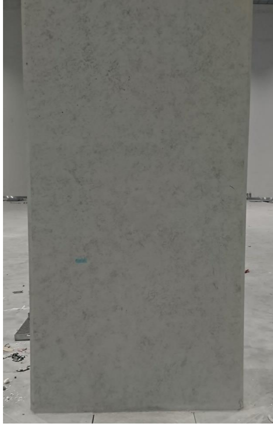
柱位現況右視 (北向面)