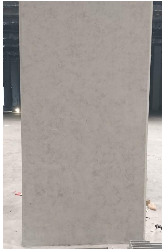
柱位現況左視 (南向面)