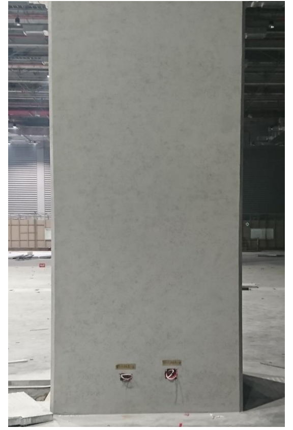
柱位現況後視 (西向面)