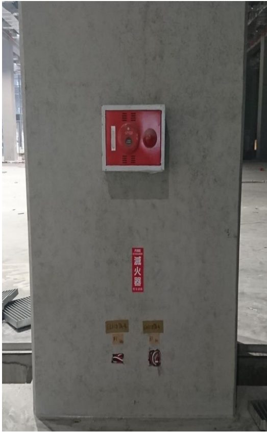
柱位現況前視 (東向面)