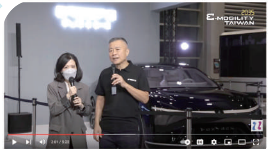
【2035 E-Mobility Taiwan】Live Tour-MIH Consortium