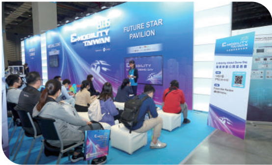
2035 E-Mobility Global Demo Day Pitch

展中辦理各項 O2O 活動，強化臺灣於國際曝光度，增加展期間業者互相交流機會，促進智慧移動的軟硬體整合能量。