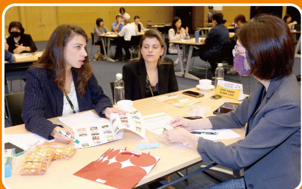
精準媒合的一對一採購洽談會