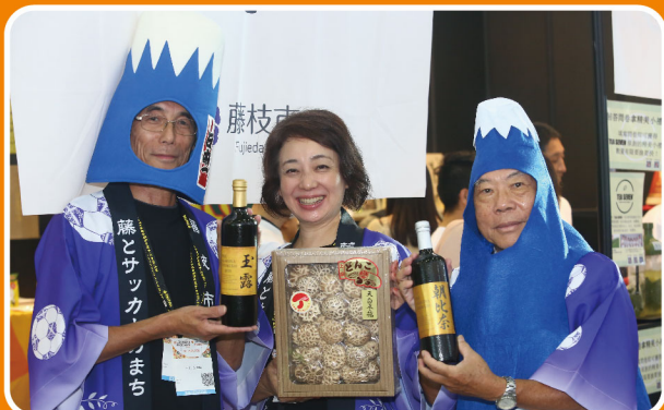
匯聚國際買主與企業的交流平台

高雄國際食品展為南臺灣規模最大、最專業的食品產業商洽平台，同期展出「高雄國際飯店、餐飲暨烘焙設備用品展」，完整展出從食品產業鏈，歡迎欲拓展內外銷市場的食品業者共襄盛舉。