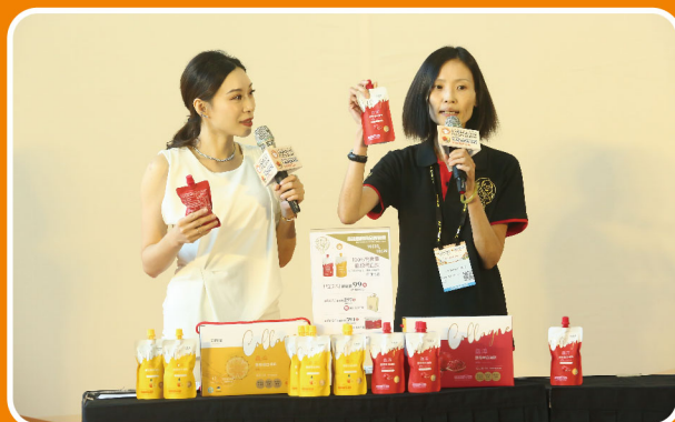
參展企業限定的產品推廣活動

海內外企業採購響應17項聯合國永續發展目標(Sustainable Development Goals, 簡稱SDGs)與落實企業責任，已漸漸盤點並要求供應商落實相關規範，根據2023年本展參觀問卷調查，有超過8成的企業採購會選擇響應SDGs目標的供應商。食品業可響應的8個SDGs永續行動舉例如下：