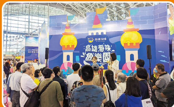
多元的舞台活動活絡人氣