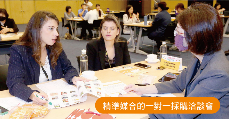
精準媒合的一對一採購洽談會