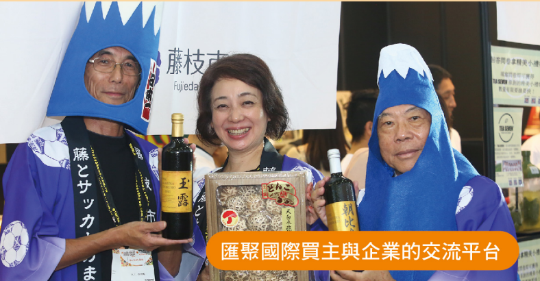
匯聚國際買主與企業的交流平台

高雄國際食品展為南臺灣規模最大、最專業的食品產業商洽平台，同期展出「高雄國際飯店、餐飲暨烘焙設備用品展」，完整展出食品產業鏈，歡迎欲拓展內外銷市場的食品業者共襄盛舉。