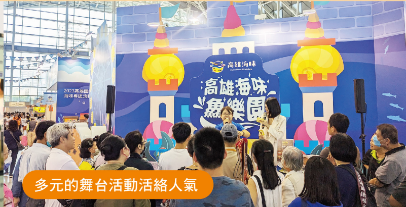
多元的舞台活動活絡人氣